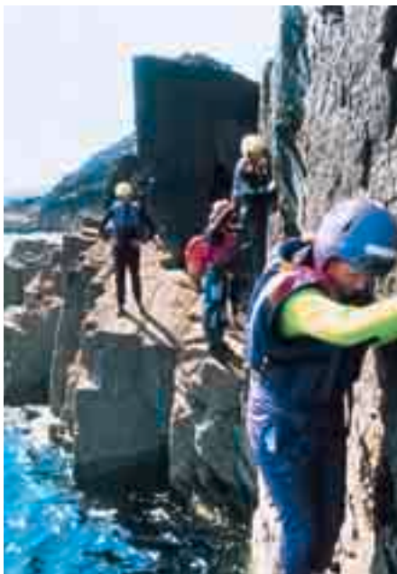
Trwy garedigwydd Cyngor Sir Benfro