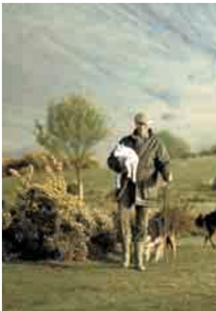
Tŷwy garedigrwydd APCBB

Amcan yr ymchwil newydd hwn yw cyflenwi gwybodaeth i Gynulliad Cenedlaethol Cymru, Awdurdodau Lleol ac eraill sy'n gwneud penderfyniadau yng Nghymru ynglŷn â gwerth economaidd tri Pharc Cenedlaethol Cymru. Dengys fod Parc Cenedlaethol Bannau Brycheiniog, Parc Cenedlaethol Arfordir Sir Benfro a Pharc Cenedlaethol Eryri yn cyfrannu'n sylweddol at economi Cymru.